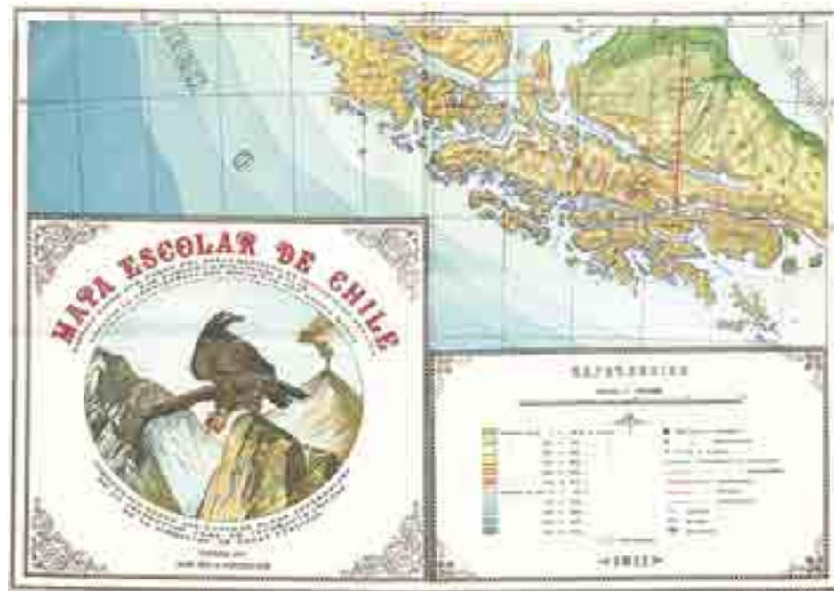
Mapa Escolar de Chile 1911, Litografía e Impresión Justus Perthes Archivo Biblioteca Nacional de Chile http://www.disenonacional.cl