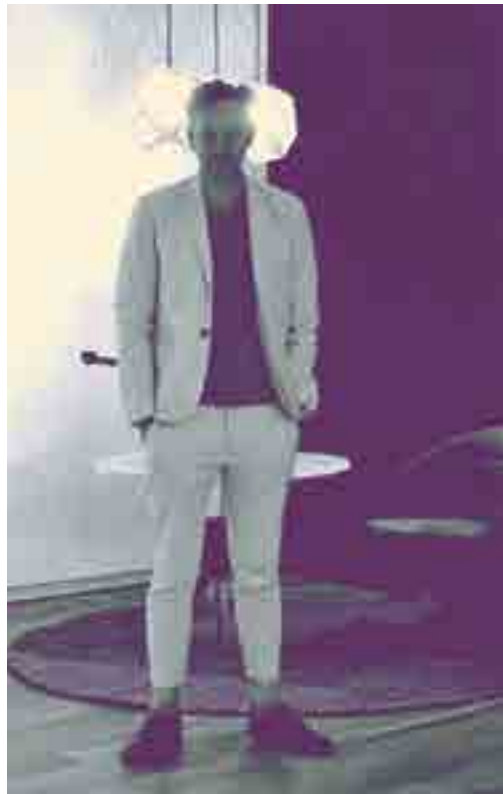
Etch Shade Copper

Tom Dixon en su visita a Chile en octubre de 2014