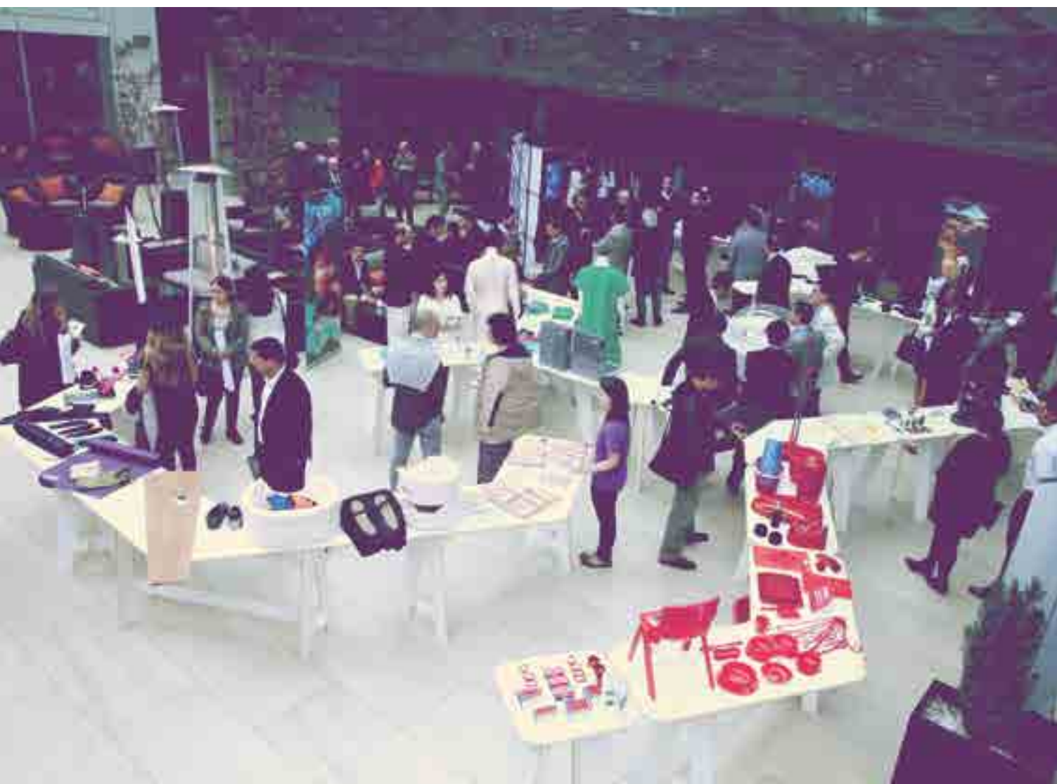
📍 Lanzamiento Copptech, producción Rodrigo Alonso

“Cualquier superficie en contacto con microorganismos puede ser revestida. Y eso hace que se transforme en antibacterial. Por lo tanto, el uso del cobre tiene un potencial casi infinito: el papel mural, las alfombras, las maderas.”