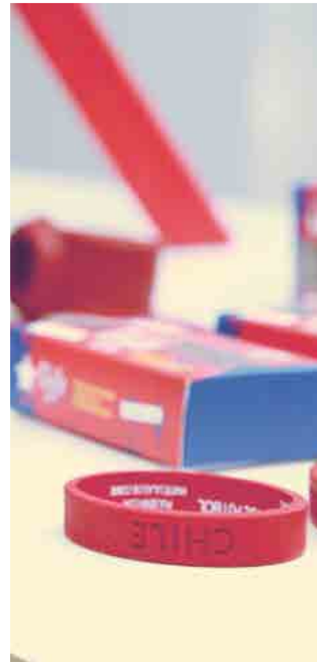
📍 Productos realizados para el lanzamiento de Copptech

R.A. Yes, to the extent that these alliances are generated. I want to continue doing things and projects with Copptech, but it is slow. Hopefully, this will generate better projects, where not only a good packaging has to be achieved, but a line of products where you can invest in better die tooling and we begin to differentiate.