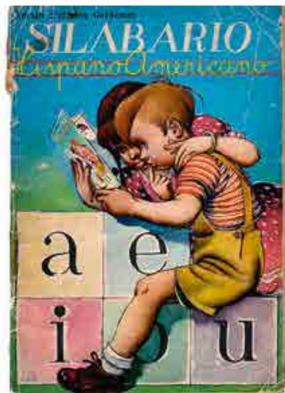
Silabario Hispanoamericano, Adrián Dufflocq Galdames